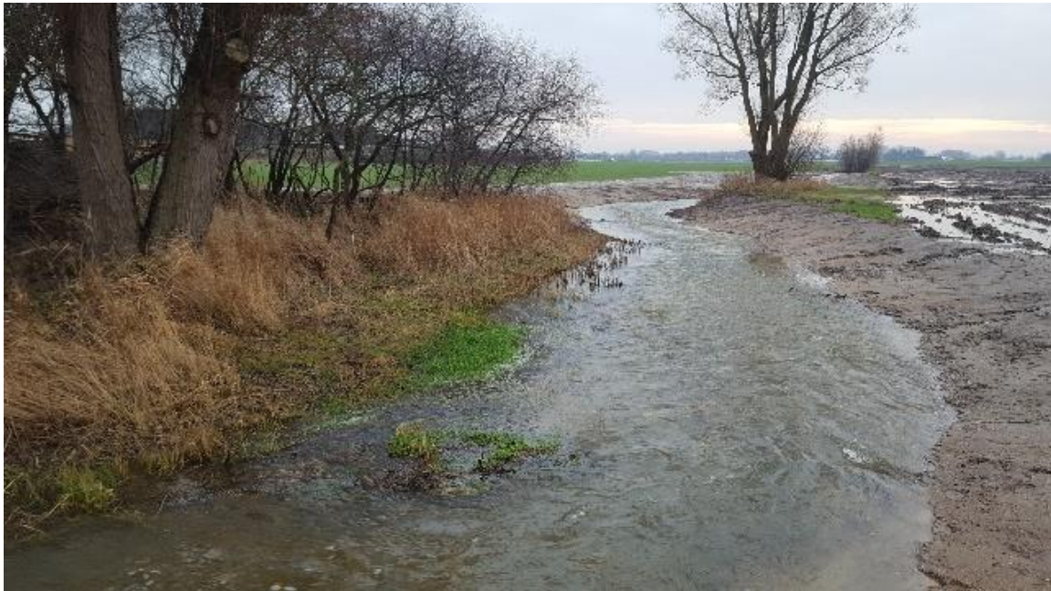
Restaurerat parti av Ståstorpsåns visningssträcka

Där landsbygd möter kuststad - ett vattendrag med stora möjligheter