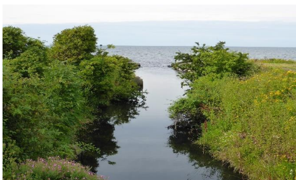
Ståstorpsåns mynning idag

Projektledaren tog redan 2016 initiativ till en utredning ” Statusbeskrivning Ståstorpsåns nedre del 2016 ” där Naturvårdsingenjörerna AB beskriver områdets historik, dess nuvarande status samt lämnar förslag på konkreta vattenvårdsåtgärder på kommunens mark.