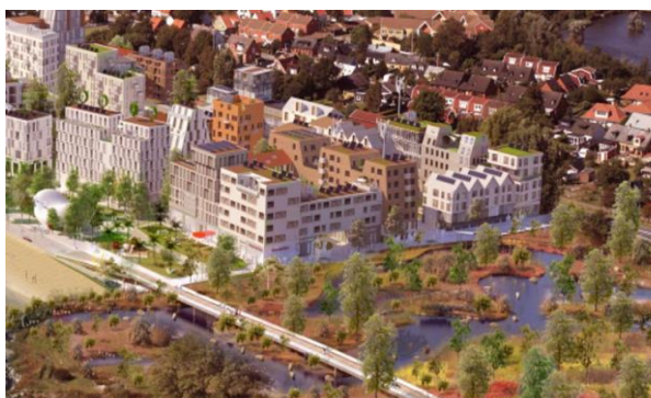
Framtidsvision från kommunens hemsida